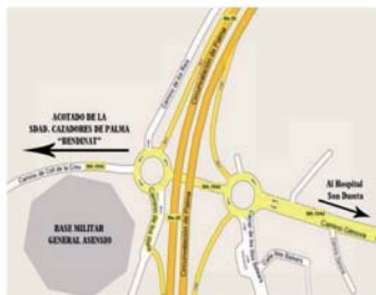
Coto Societat de caçadors de Palma